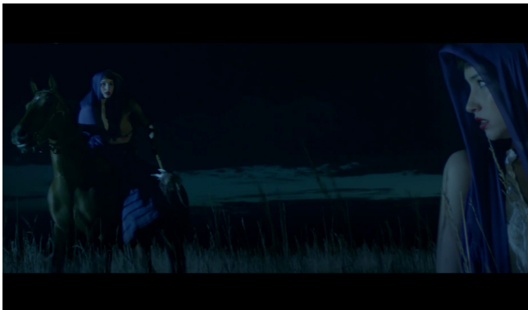
La sabiduría , de Eduardo Pinto (2020).

Y otra vez, el caballo: testigo atemporal. El ojo que todo lo ve.