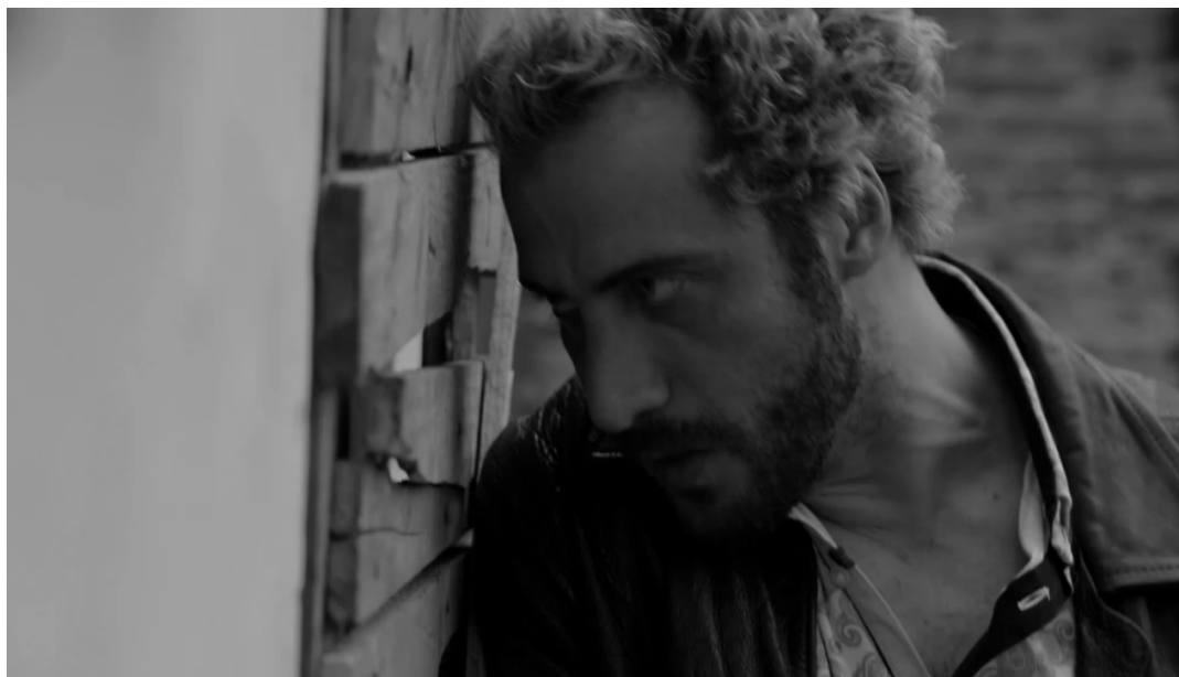
Corralón , de Eduardo Pinto (2017).