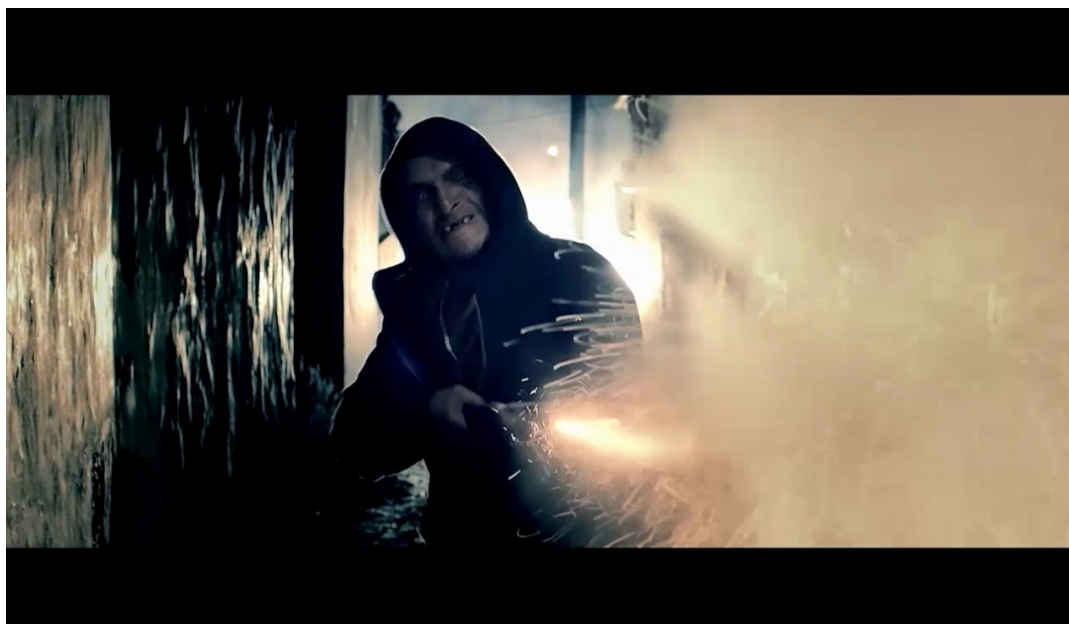
Caño dorado , de Eduardo Pinto (2009).

“Aguante el Gauchito Gil”, dice un pibe en medio de la procesión del 8 de diciembre en la villa de Caño Dorado . El pibe desdentado / carcomido por la pobreza y las drogas, el que mira al espectador, con el caño, tirando a lo loco hasta matar al ojo que ve, configura el mismo procedimiento faviano.